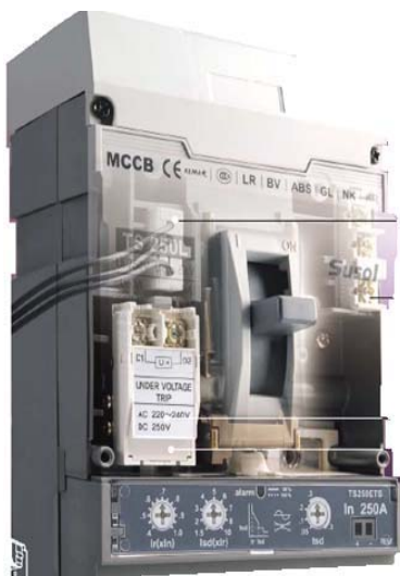
Interruptor de 160 A con intensidad y tiempo de actuación regulables.