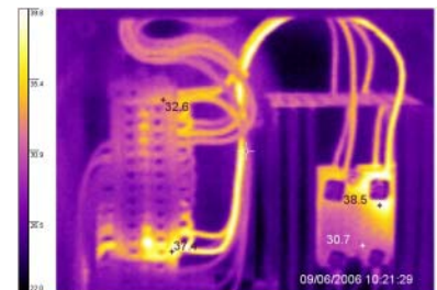
Cables a 39 grados. Un segundo de cortocircuito sumaría 50 grados, y las vainas se fundirían.

Por ejemplo, si queremos que cuando se ponga en marcha un motor de veinte caballos (cuya corriente normal es de 15 A, pero en el arranque toma 100) la tensión de fase descienda sólo dos décimas de voltio, eso implica, proporcionalmente, que cuando se produzca un cortocircuito y la tensión descienda a cero, la corriente superará los diez mil amperes. Ése es el inconveniente de una instalación cuya tensión permanezca casi constante a pesar del consumo: En caso de cortocircuito la corriente resulta muy grande, de decenas de miles de amperes; y si pasa por los conductores durante un tiempo excesivo, los fundirá, o quemará sus vainas aislantes. 2 En este caso los elementos de protección tienen que actuar con una demora mínima, ya que por cada décima de segundo de retardo en la interrupción, la temperatura de los cables o barras subirá, en este ejemplo, más de cinco grados.